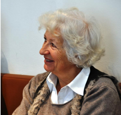
profil de l'auteur