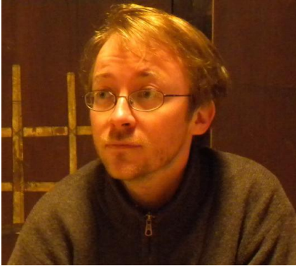
profil de l'auteur